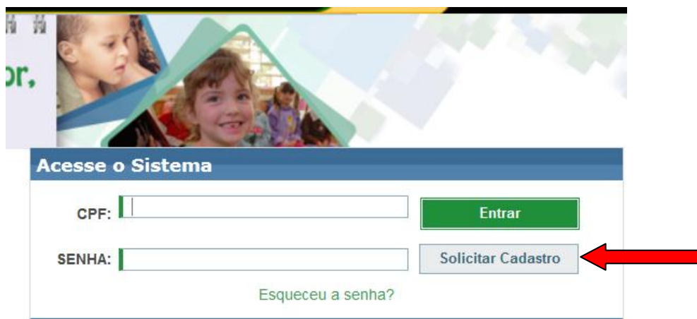
Tela de Cadastro_01

Face a todas as responsabilidades, o Ministério da Educação orienta que o Comitê tenha entre 2 (dois) a 10 (dez) membros permanentes, técnicos efetivos, pois representam a palavra da Secretaria de Educação. Por esta razão, recomenda-se que esta equipe, assim como Coordenador, se necessário, seja designada formalmente pelo(a) dirigente de educação, por meio de um decreto, portaria ou qualquer outro documento oficial. O próximo passo é solicitar o cadastro na plataforma PDE Interativo. Para isso, deve-se acessar o endereço eletrônico http://pdeinterativo.mec.gov.br e clicar em, Solicitar Cadastro , conforme apontado na figura a seguir: