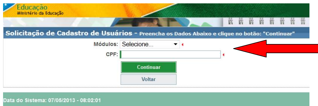
Tela de Cadastro_02